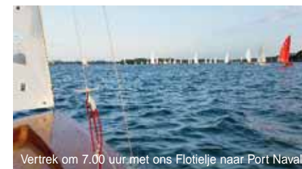
Vertrek om 7.00 uur met ons Flotielje naar Port Navalo.