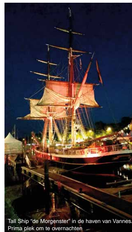
Tall Ship "de Morgenster" in de haven van Vannes. Prima plek om te overnachten