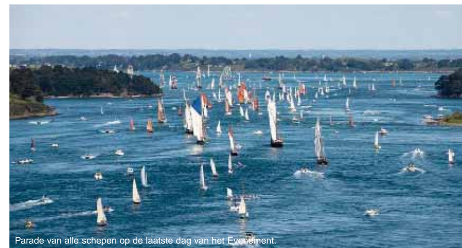
Parade van alle schepen op de laatste dag van het Eventement.