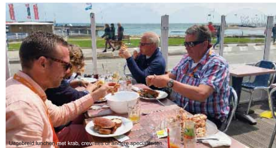
Uitgebreid lunchen met krab, crevettes of andere specialiteiten.