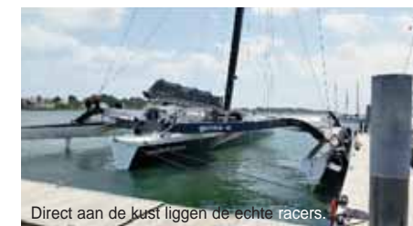
Direct aan de kust liggen de echte racers.