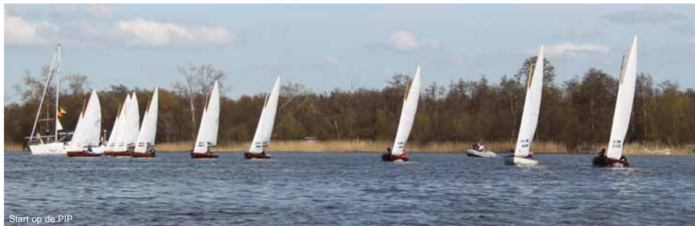
Start op de PIP