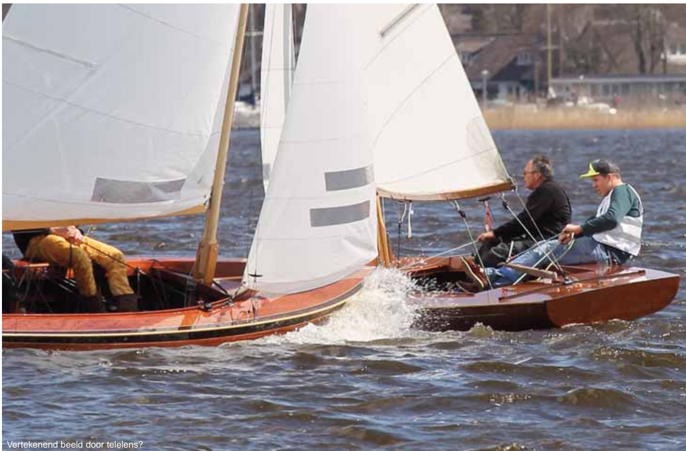
Vertekend beeld door teelens?